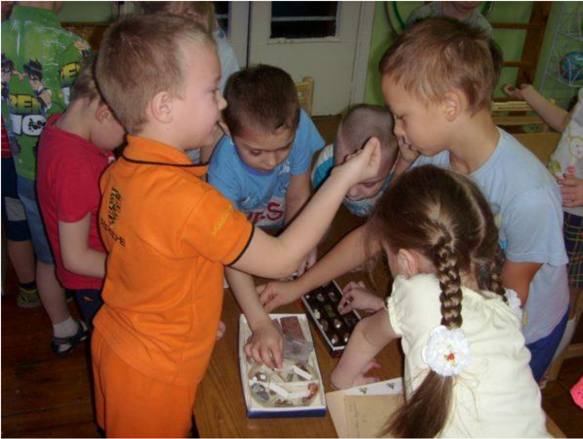
Изучение минералов заинтересует воспитанников старшей и подготовительной групп