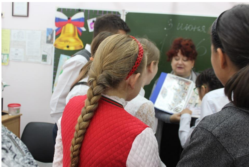
Фото с Музейного часа «История нашей школы № 8»