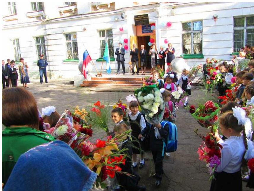
Линейка первого звонка в МБОУ ОШ № 14