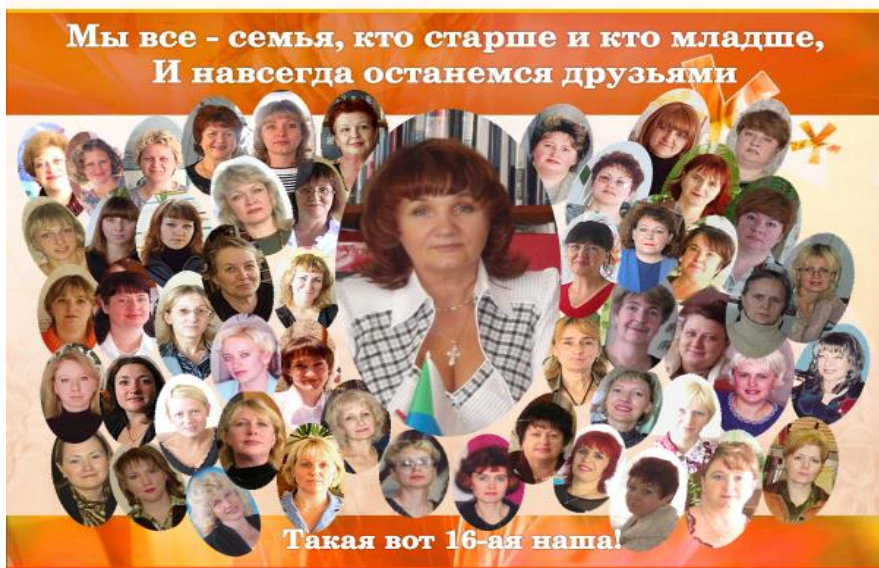
Школьный баннер «Такая вот 16-ая наша»