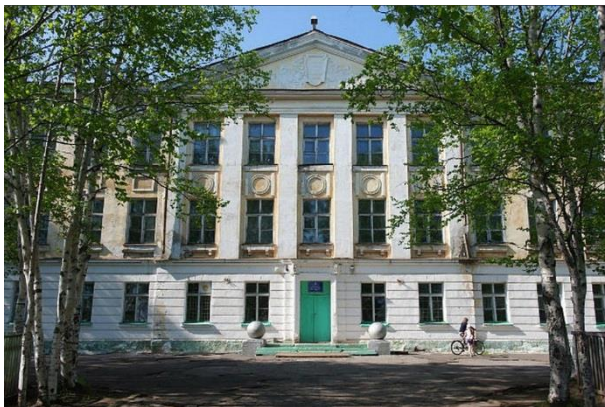
2019 год. МБОУ ОШ № 14 р.н. Майский

В далекий, тяжелый, послевоенный, голодный 1945 год, в небольшом поселке Бяудэ открывается восьмилетняя школа № 21. Какой она была? Очень маленькая, деревянная.