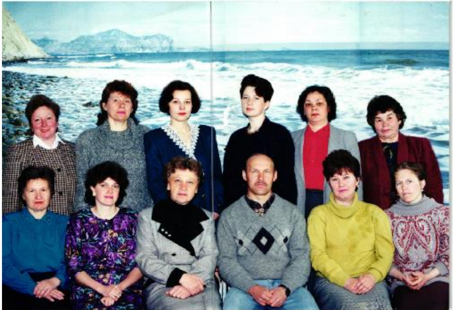
Педагогический коллектив 1994 г.