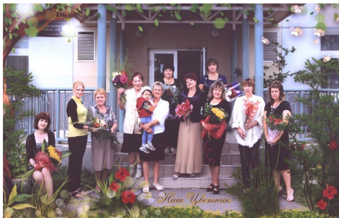
Педагоги МБОУ ОШ № 8

Учитель: Благодарю всех участников нашего «Часа истории» за активность и преданность нашей школе! Приглашаю всех на чаепитие!