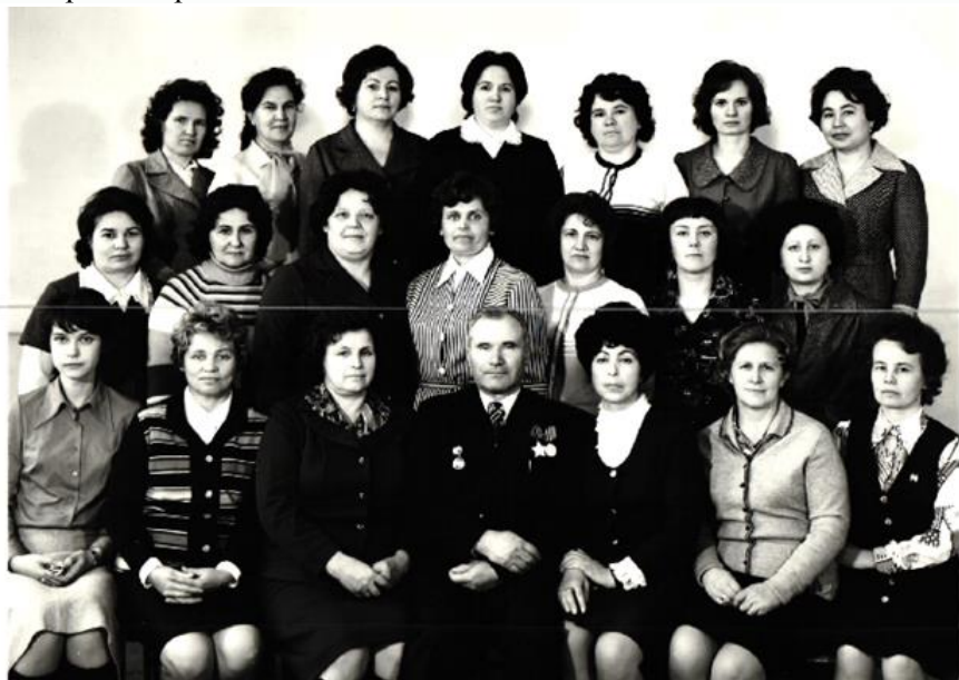
Педагогический коллектив. 1976 г.