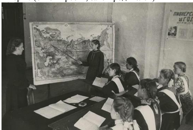
60-е годы. На уроке географии

Учитель: Кто знает, к чему были готовы всегда школьники - пионеры? (ответы ребят, затем родителей)