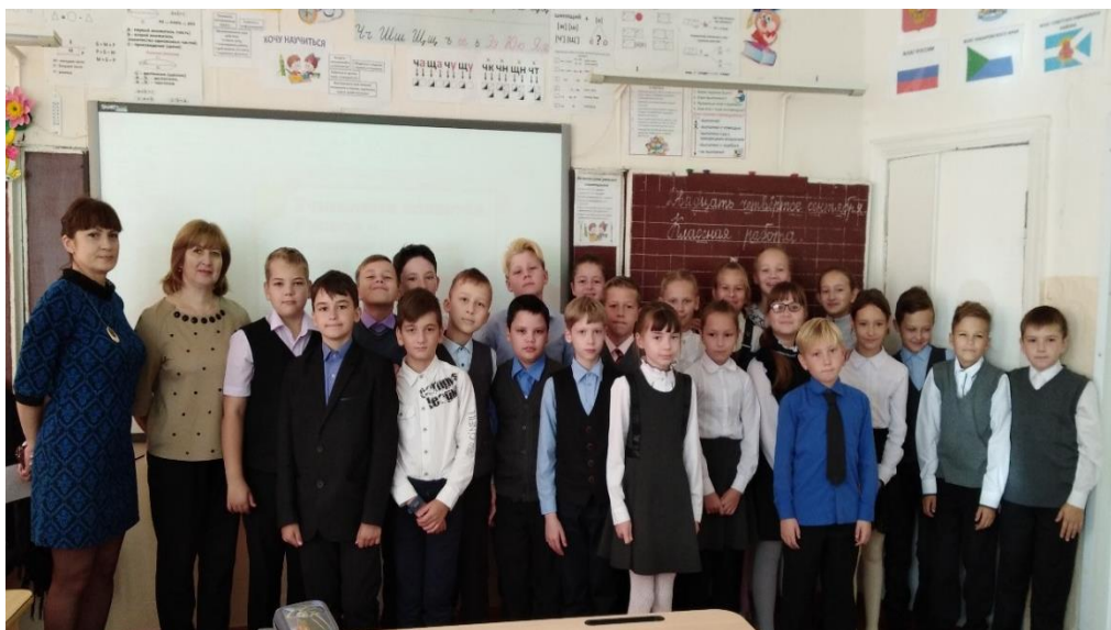
На фото: участники музейного часа

У меня в классе была ученица, которая одинаково красиво писала и левой, и правой рукой. Эта девочка окончила школу с серебряной медалью.