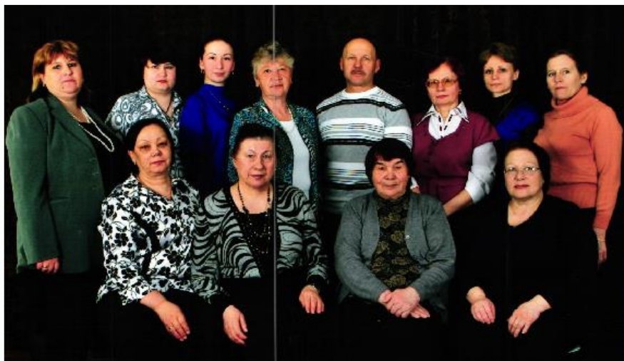
Педагогический коллектив 2010 г.