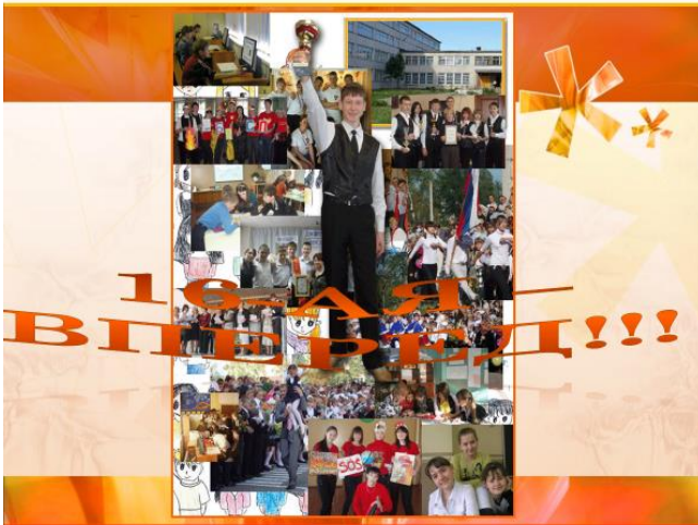
Школьный баннер «16-ая, вперёд!»

Есть среди множества школ на планете Школа, где много идей, Школа открытий, где силы в расцвете, Школа подруг и друзей. ««Кузница кадров» и «Знаний обитель»», - Люди про нас говорят. Будь педагог ты, учитель, родитель - Все в нашей школе творят. Припев