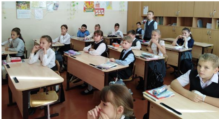
Учащиеся внимательно слушают рассказы учителей

- Кто, ребята, знает, что означает слово «династия»?