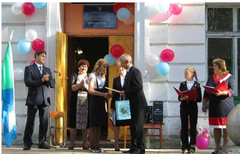
Вручение наград учащимся на школьной линейке

Второй экскурсовод. Прошли годы. Пусть в настоящее время школа немногочисленная, но ее престиж от этого не упал, потому что в школе работает очень дружный педагогический коллектив.