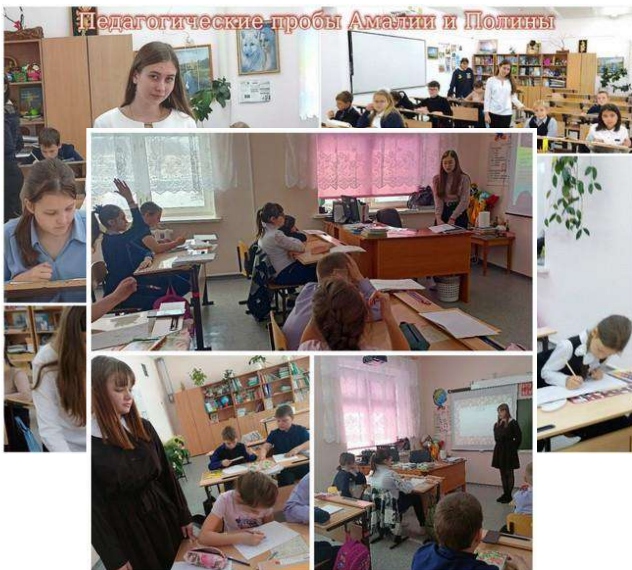
Приложение 2.