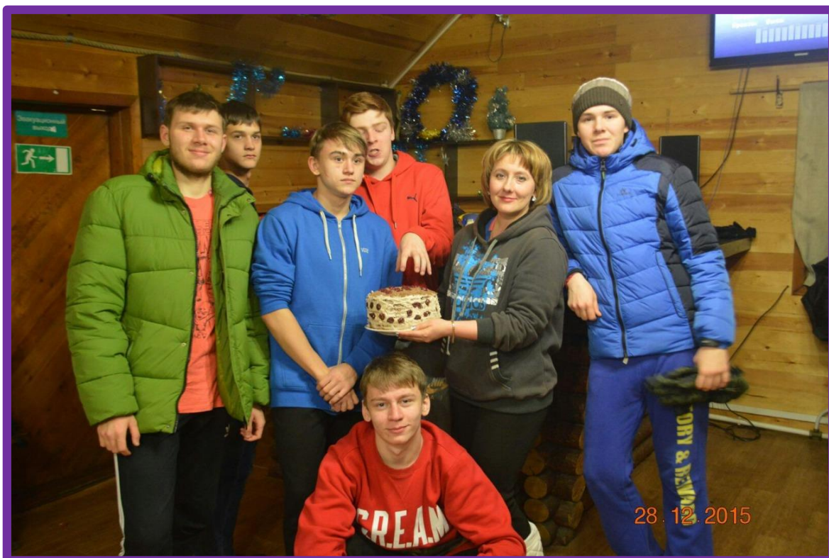
С ОДНОКЛАССНИКАМИ И КЛАССНЫМ РУКОВОДИТЕЛЕМ