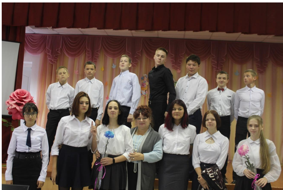
ДЕНЬ УЧИТЕЛЯ 2021г. С УЧЕНИКАМИ МБОУ ОШ № 8