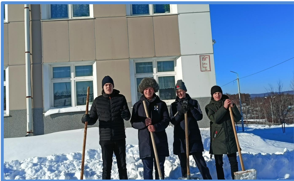
ЧИСТКА ДВОРА ОТ СНЕГА СО СТАРШЕКЛАСНИКАМИ МБОУ ОШ № 8