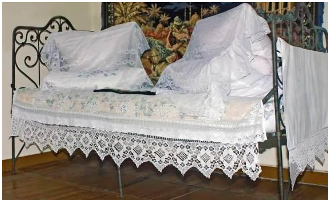
Эти покрывала хранились в нашем комодe