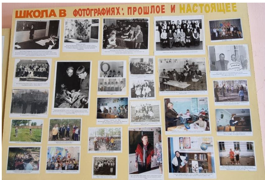
Приложение 7. Экспозиция «История школы»