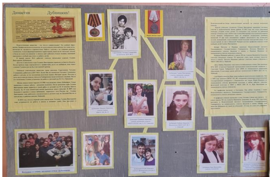
Приложение 8 Экспозиция «Педагогические династии»