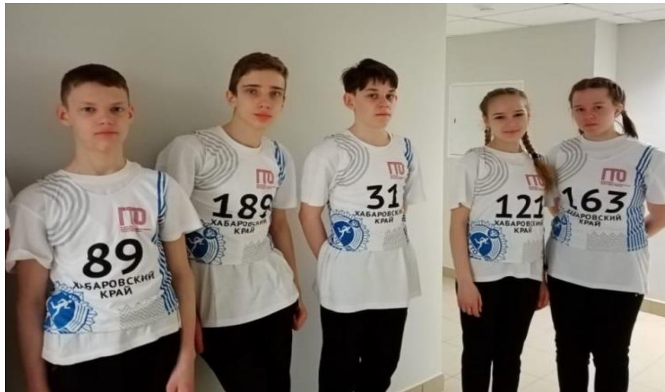
Класс-команда МБОУ ОШ № 2 на краевом этапе Всероссийских спортивных соревнований школьников «Президентские состязания»