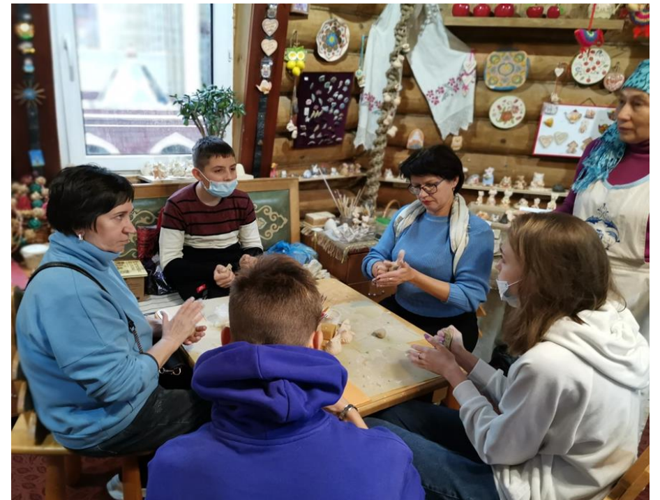
обучающиеся МБОУ СШ № 16 в русской избе