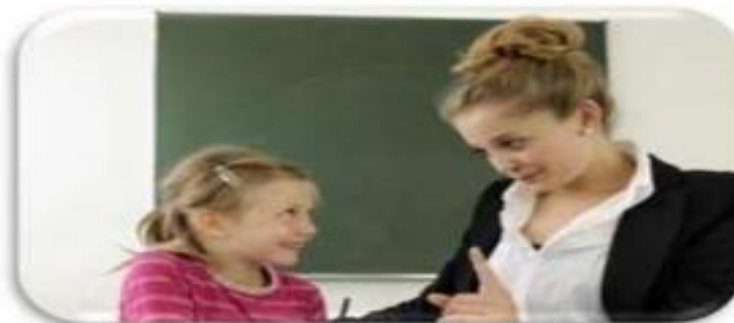
Индивидуальная работа с учащимися