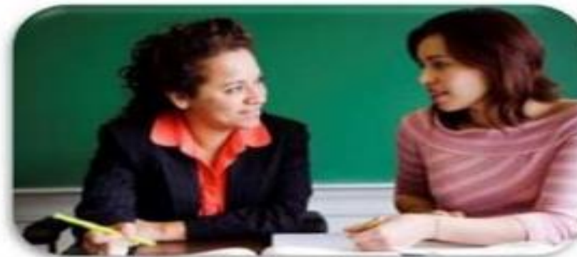
Работа с учителями-предметниками