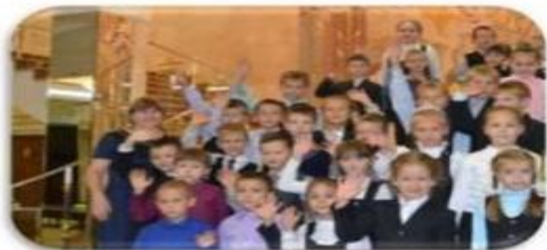
Работа с классом