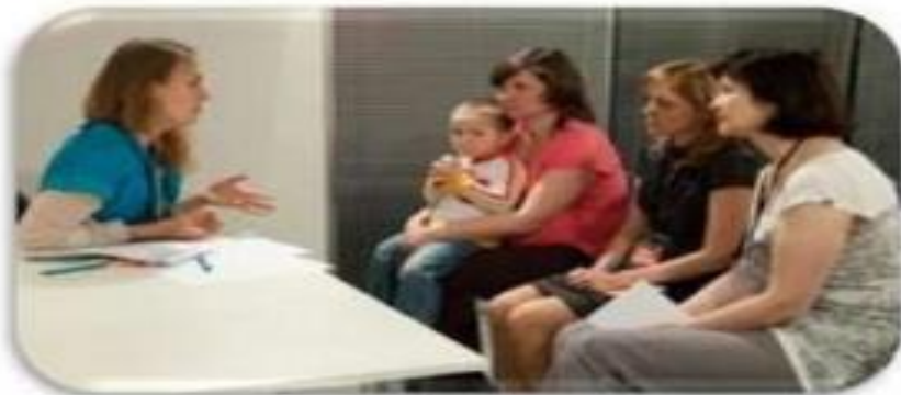
Работа с родителями