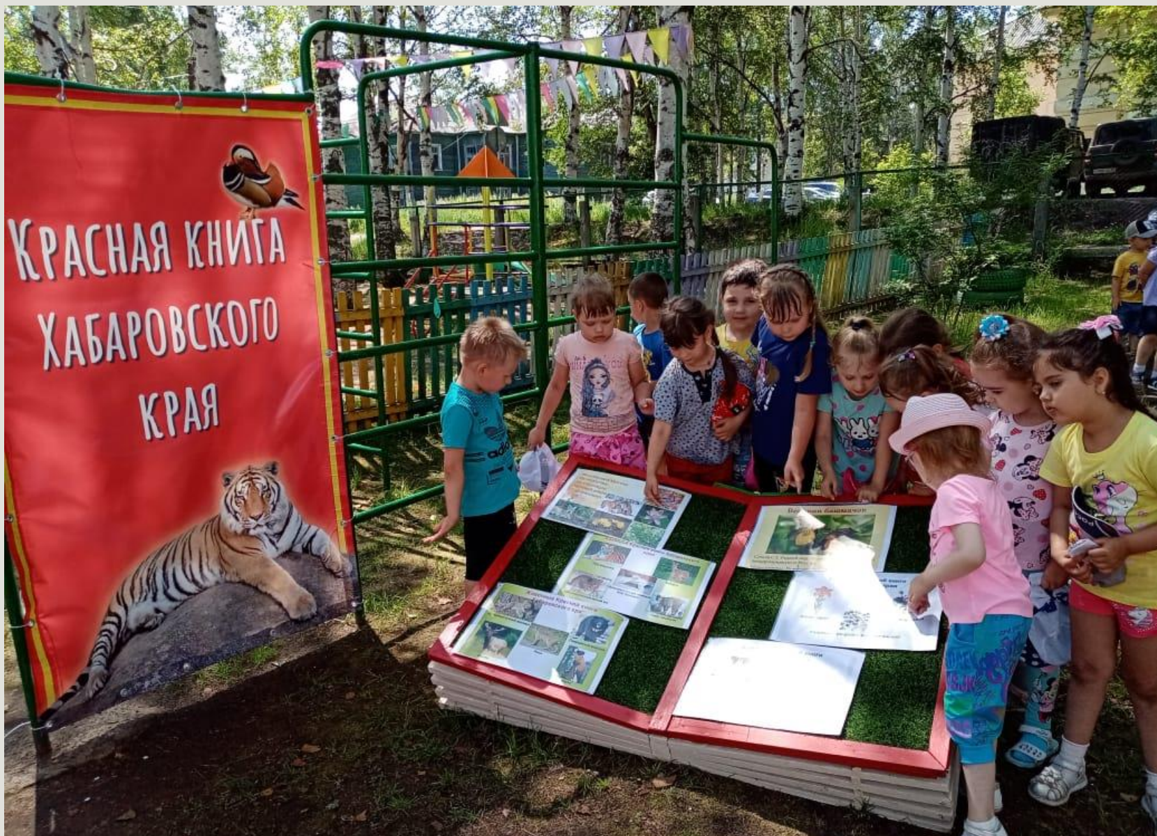
Проект «Красная книга Хабаровского края»