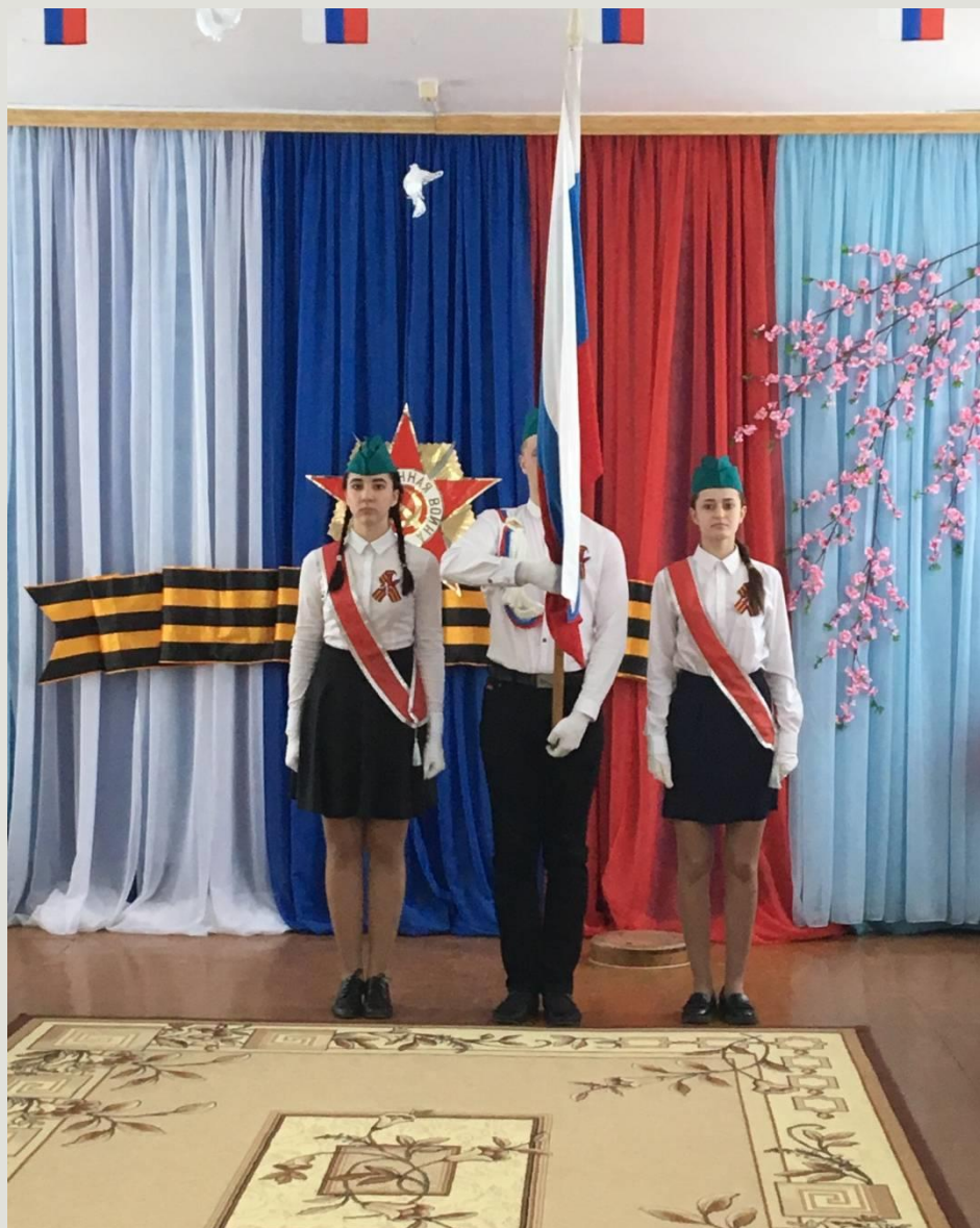
«Знаменная группа» МБОУ СШ № 6