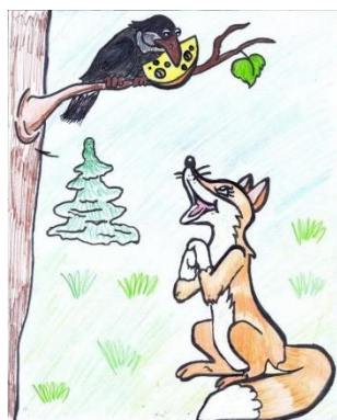
Ворона и лисица

Уж сколько раз твердили миру, Что лезть гнусна, вредна; но только все не впрок, И в сердце льстец всегда отыщет уголок. Вороне где-то бог послал кусочек сыру; На ель Ворона взгромоздясь, Позавтракать было совсем уж собралась, Да призадумалась, а сыр во рту держала. На ту беду Лиса близехонько бежала; Вдруг сырный дух Лису остановил: Лисица видит сыр, – Лисицу сыр пленил. Плутовка к дереву на цыпочках подходит; Вертит хвостом, с Вороны глаз не сводит И говорит так сладко, чуть дыша: "Голубушка, как хороша! Ну что за шейка, что за глазки! Рассказывать, так, право, сказки! Какие перышки! Какой носок! И, верно, ангельский быть должен голосок! Спой, светик, не стыдись! Что ежели, сестрица, При красоте такой и петь ты мастерица, Ведь ты б у нас была царь-птица!"