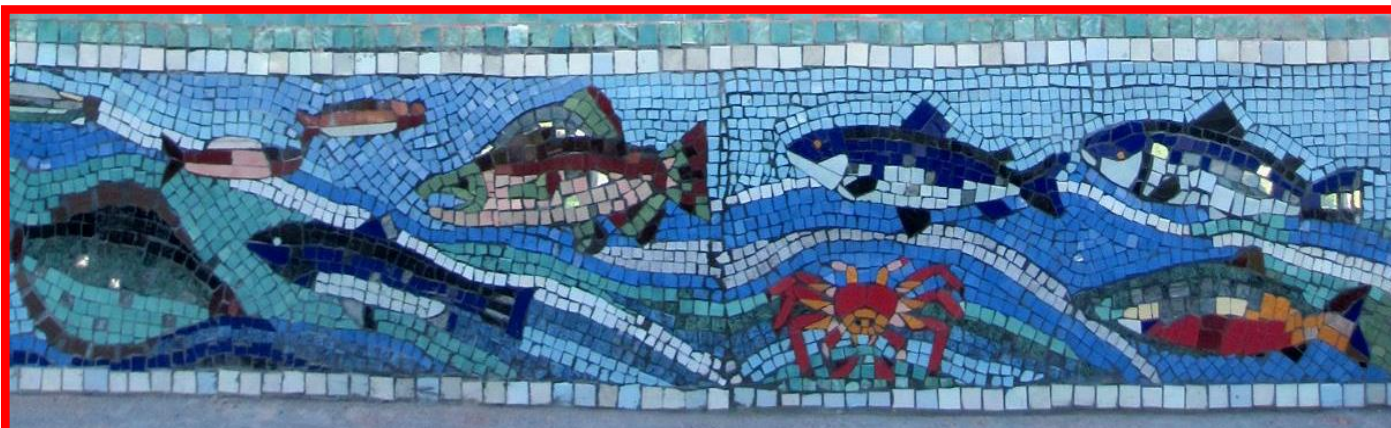
«ОБИТАТЕЛИ ВОДЫ» - ПАННО НА СТЕНЕ РАЙОННОГО КРАЕВЕДЧЕСКОГО МУЗЕЯ им. Н.К. БОШНЯКА, 2015 г.