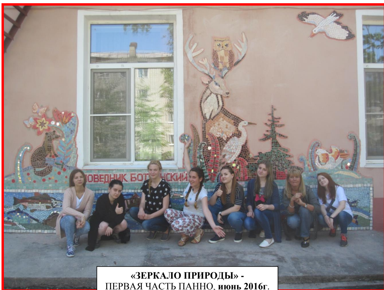
«ЗЕРКАЛО ПРИРОДЫ» - ПЕРВАЯ ЧАСТЬ ПАННО, ИЮНЬ 2016г.