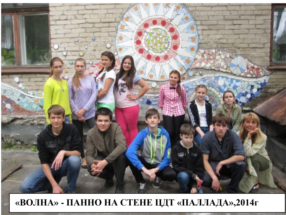
«ВОЛНА» - ПАННО НА СТЕНЕ ЦДТ «ПАЛЛАДА», 2014г