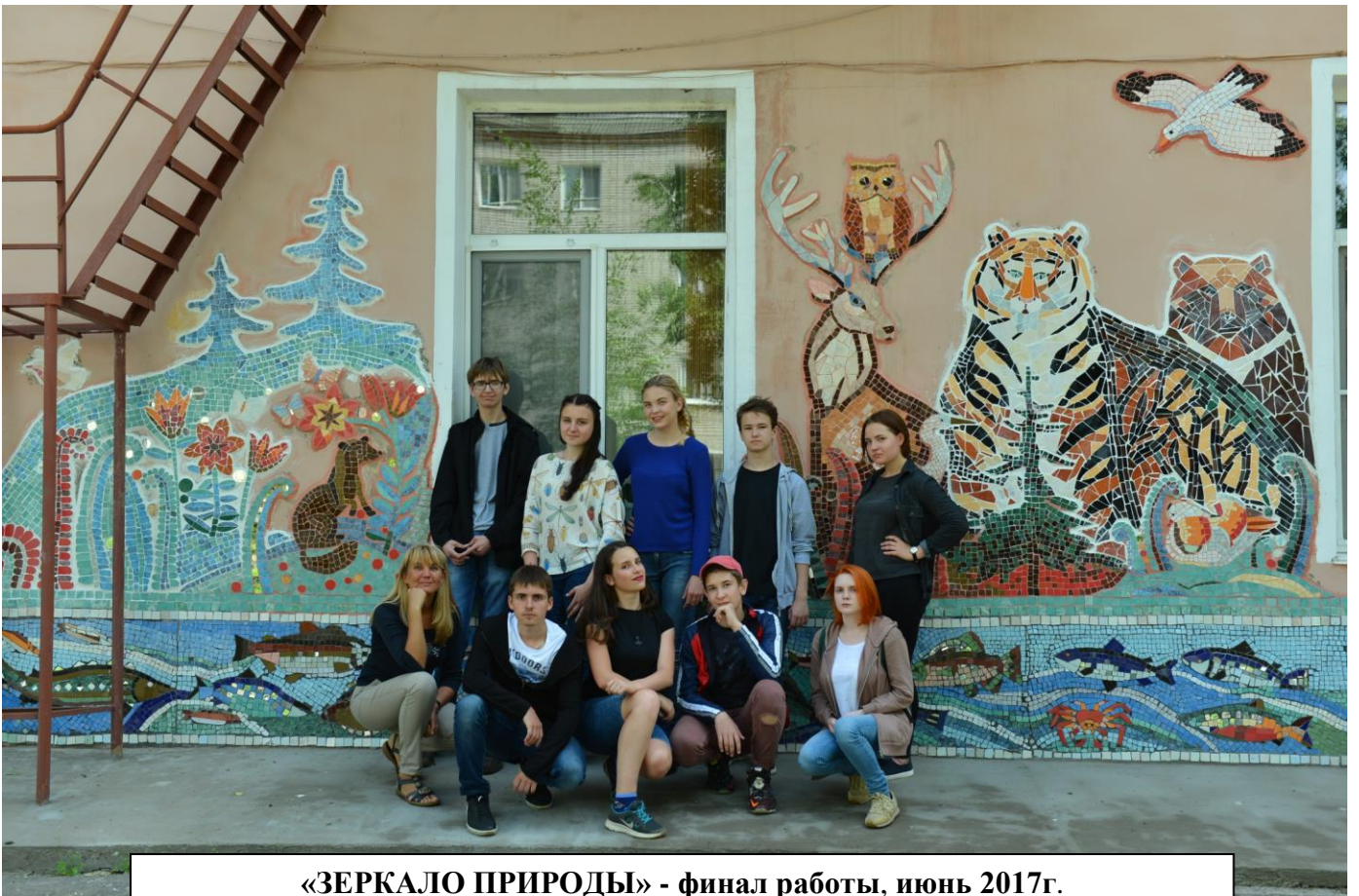
«ЗЕРКАЛО ПРИРОДЫ» - финал работы, июнь 2017г.