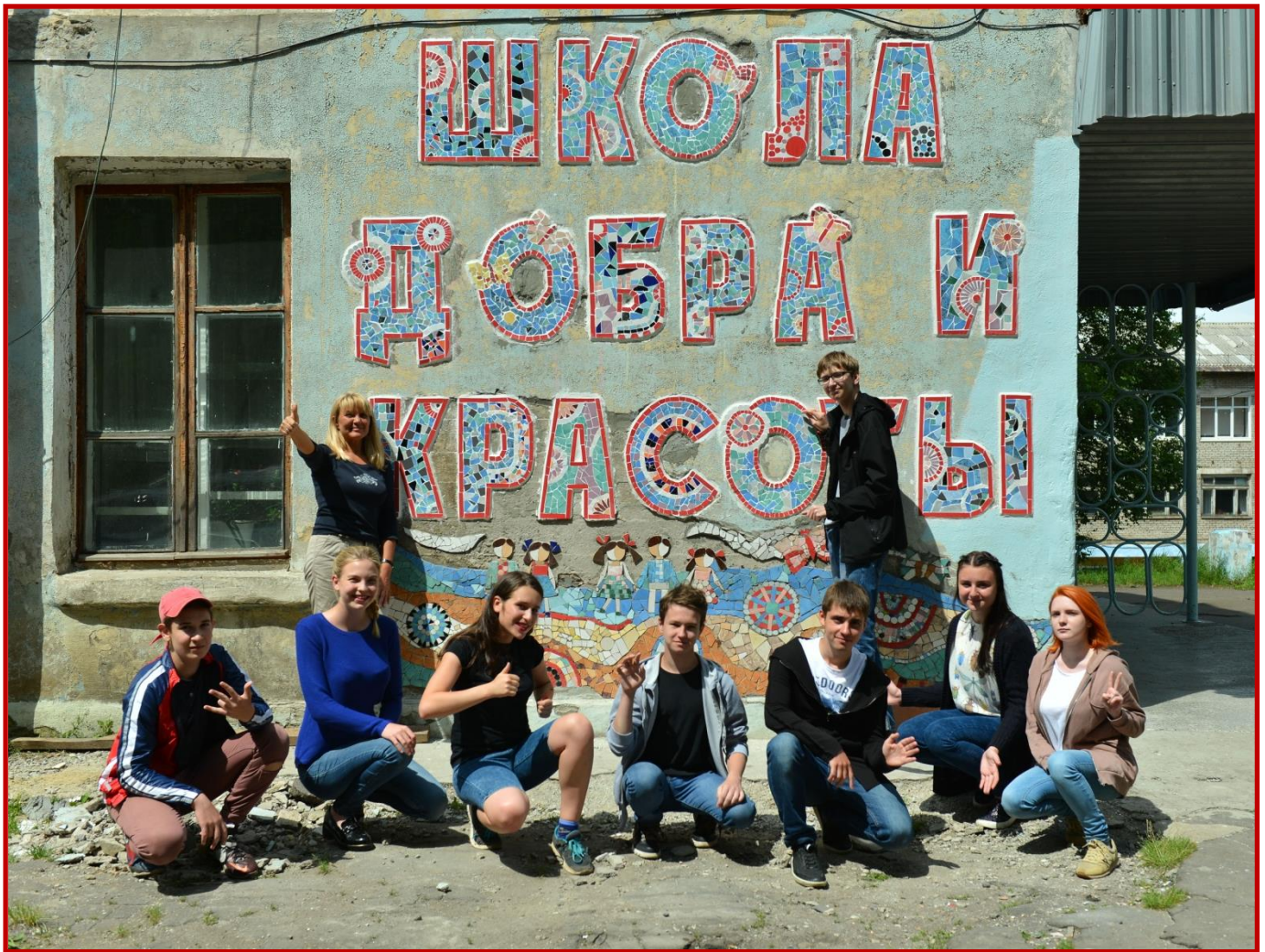
«ШКОЛА ДОБРА И КРАСОТЫ» - ПАННО НА СТЕНЕ ДЕТСКОЙ ШКОЛЫ ИСКУССТВ, июль 2017 -