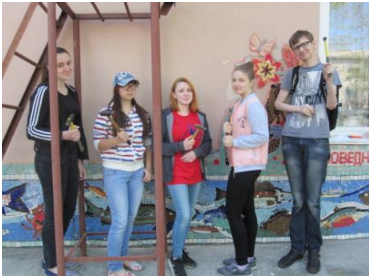
«ЗЕРКАЛО ПРИРОДЫ» - ВМЕСТЕ С ОПЫТНЫМИ МОЗАИЧИСТАМИ И НОВЫЕ РЕБЯТА ПРОБУЮТ СВОИ СИЛЫ, июнь 2017г.