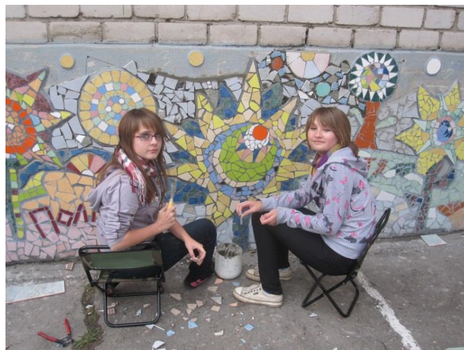
ПАННО НА СТЕНЕ ДОУ №39