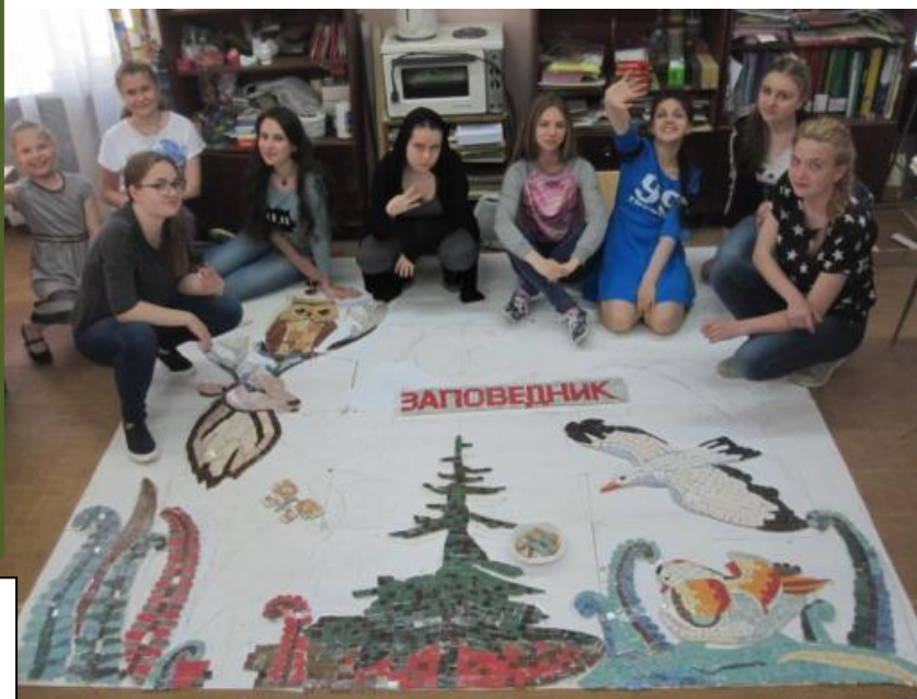
«ЗЕРКАЛО ПРИРОДЫ» - ЭСКИЗ РАЗРАБОТАЛА ВЕРА ПОПРУГА (17 лет)